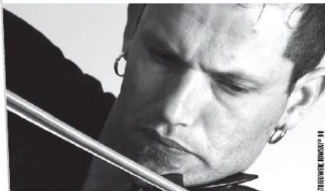
MATHIEU WERCHOWSKI © H